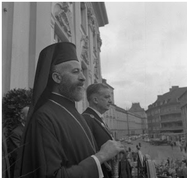
SB MAKARIOS III, Mijail Kristodulos Muskos (1913-1977)