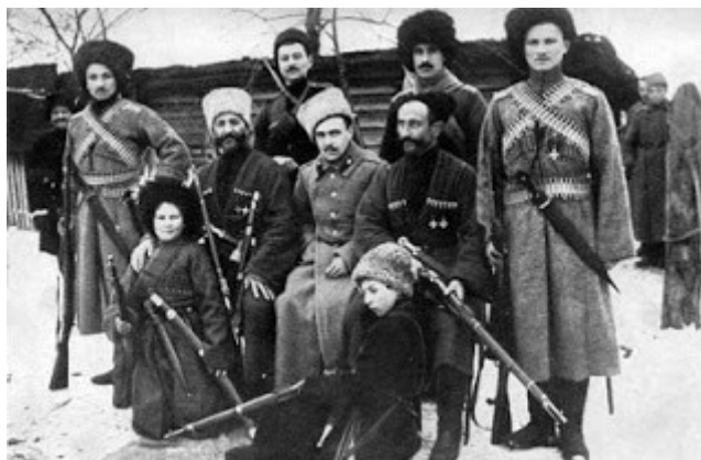
Tropas rusas durante la Segunda Guerra Mundial